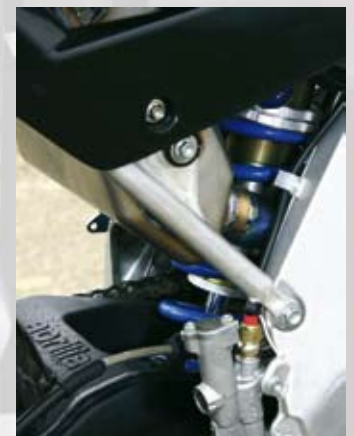
Der Stoßdämpfer wurde überarbeitet und mit einer neuen Feder versehen