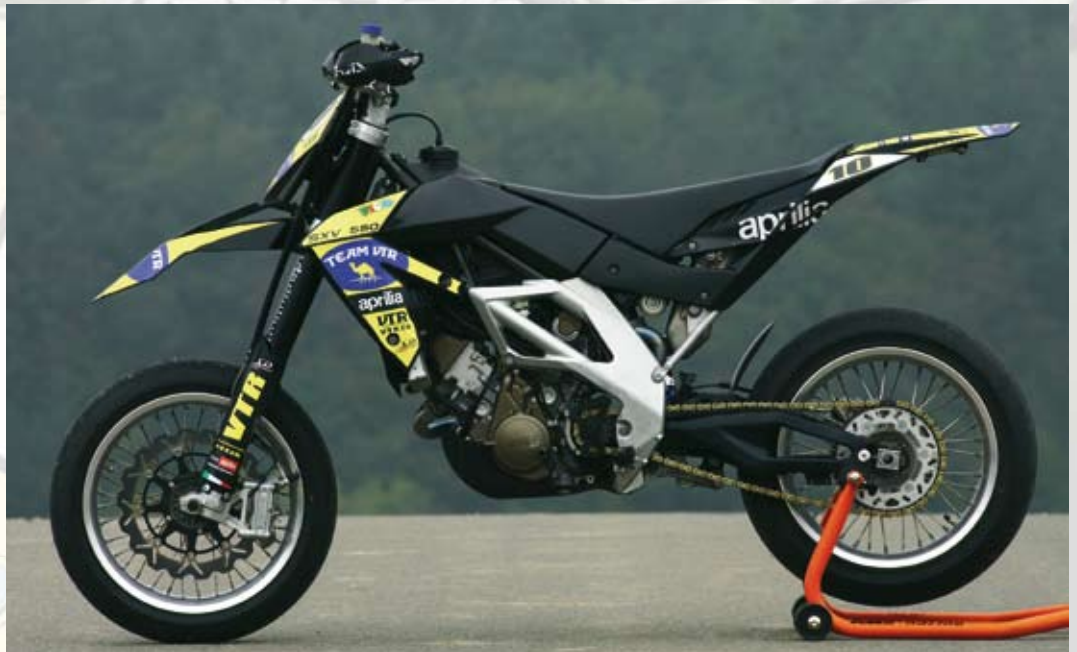
Die VTR Aprilia überzeugt mit feinem Dekorsatz und technischen Modifikationen