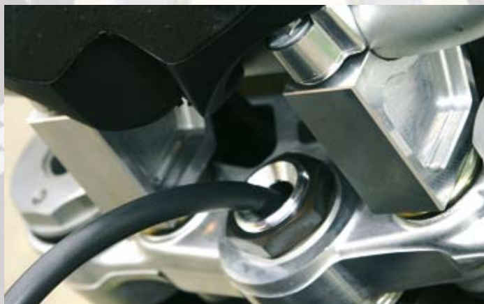
Hauseigene Adapter erhöhen den Lenker